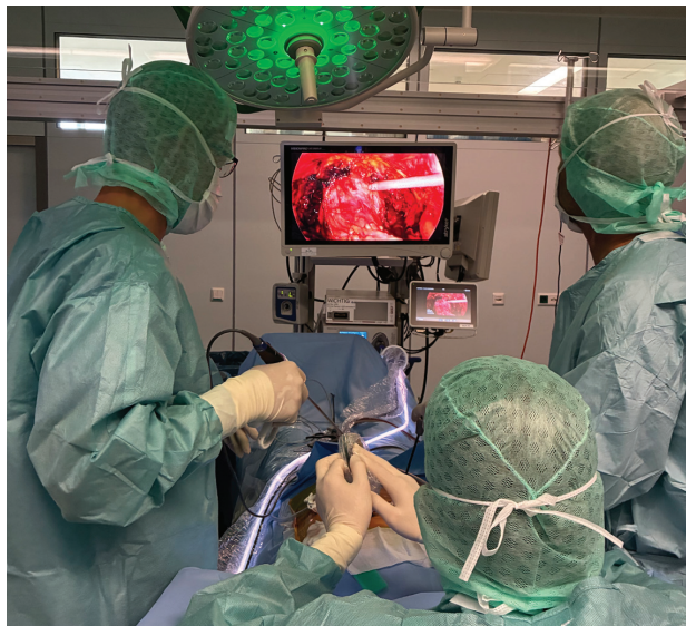
Operation als häufigste Behandlungsmethode